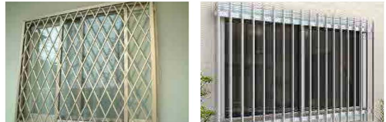
クロス格子タイプ